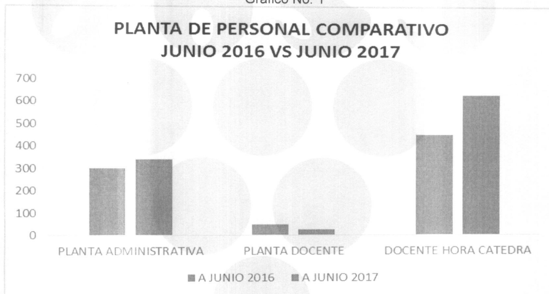
Gráfico No. 1

Fuente: Datos consolidados y reportados por GNV-ESAP