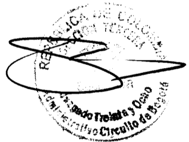
OLGA LIGIA ARAQUE MORENO CONVOCADA